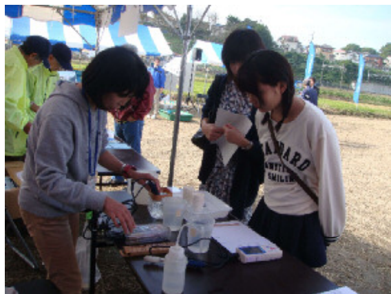
パックテストの体験コーナー