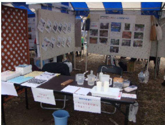
展示ブースの状況

平成 26 年 10 月 26 日、佐倉市ふるさと広場で開催した「印旛沼体験フェア」に出展し、印旛沼流域の湧水のポスターによる紹介のほか、出版物の展示、及び湧水や井戸水のパックテストによる簡易水質測定を行った。