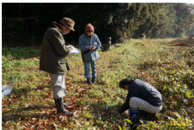
試料採取（菖蒲谷津）