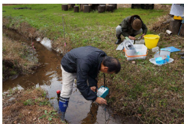
流量測定（天神谷津）