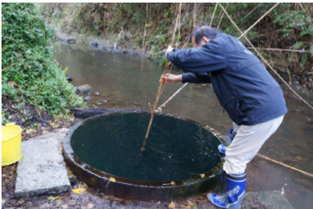
調査風景 (神余の弘法井戸)