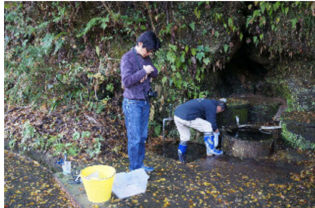
調査風景 (大貫の湧水)