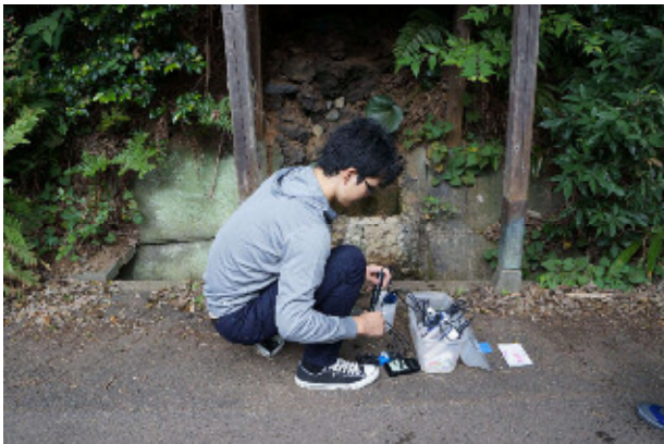
調査風景 (船戸の森湧水)

調査期間：平成 26 年 9 月～平成 26 年 12 月 調査地点リストは下表のとおり