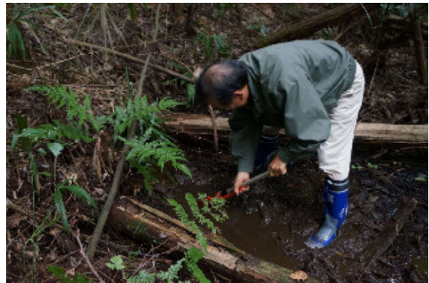
調査風景 (大下の湧水)